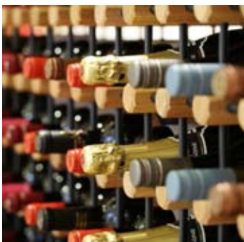
Lotte Hotel Busan

기간 2월 29일까지 가격 에스프레소 마티니 ₩ 13,000 / 블루베리 마티니 ₩ 13,000 / 화이트초코 마티니 ₩ 13,000 키위 마티니 ₩ 13,000 / 스페셜 더티 마티니 ₩ 13,000 (세금 및 봉사료 별도) 문의 051.810.6430